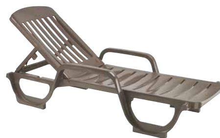
Taupe CD 030 181