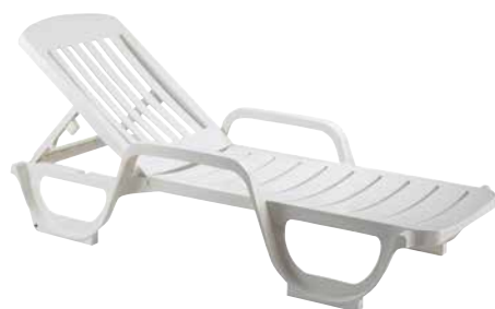
Blanc CD 030 004