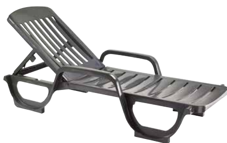
Anthracite 24 701 002