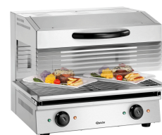
► Avec fonction de lift pratique ✓ Hauteur libre : 65 - 210 mm