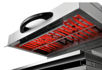
► Salamandre avec 2 zones chauffantes