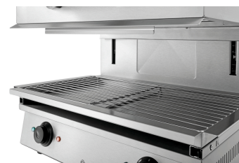
► Dimensions de la grille ✓ L 590 x P 320 mm